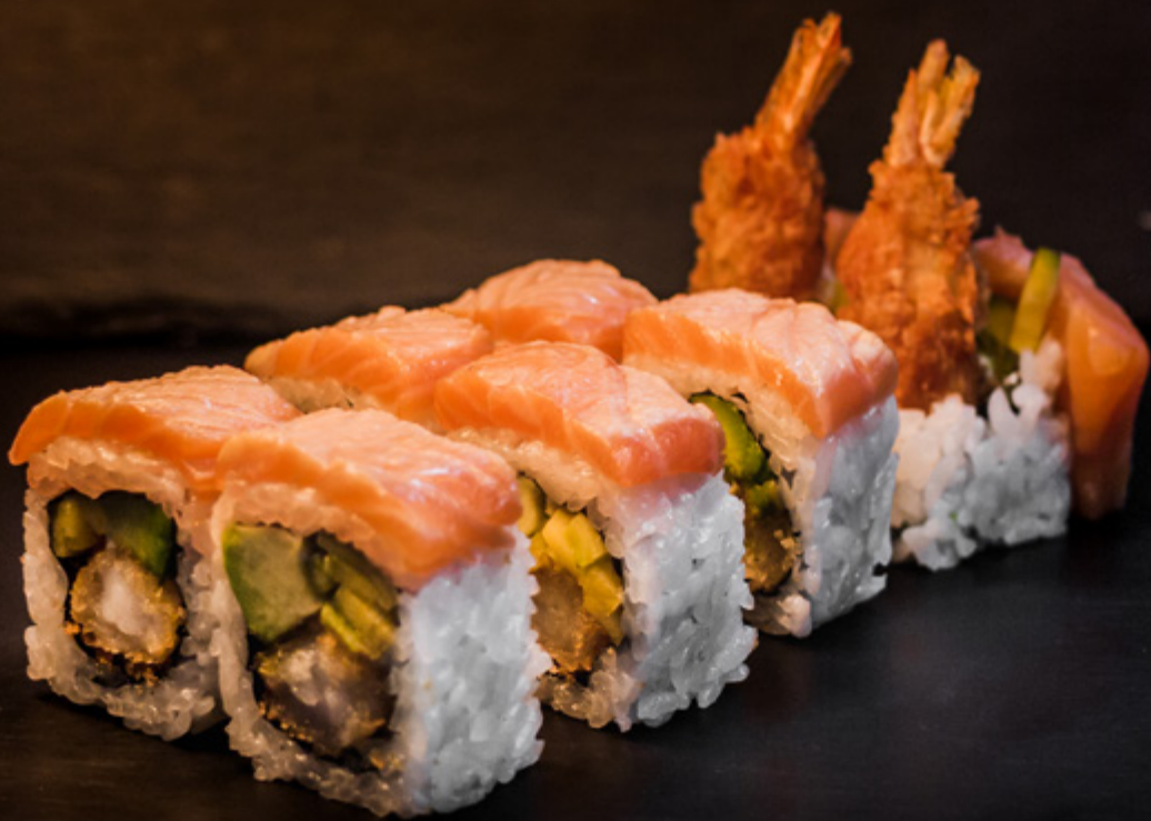
H47 - CRISPY TIGER