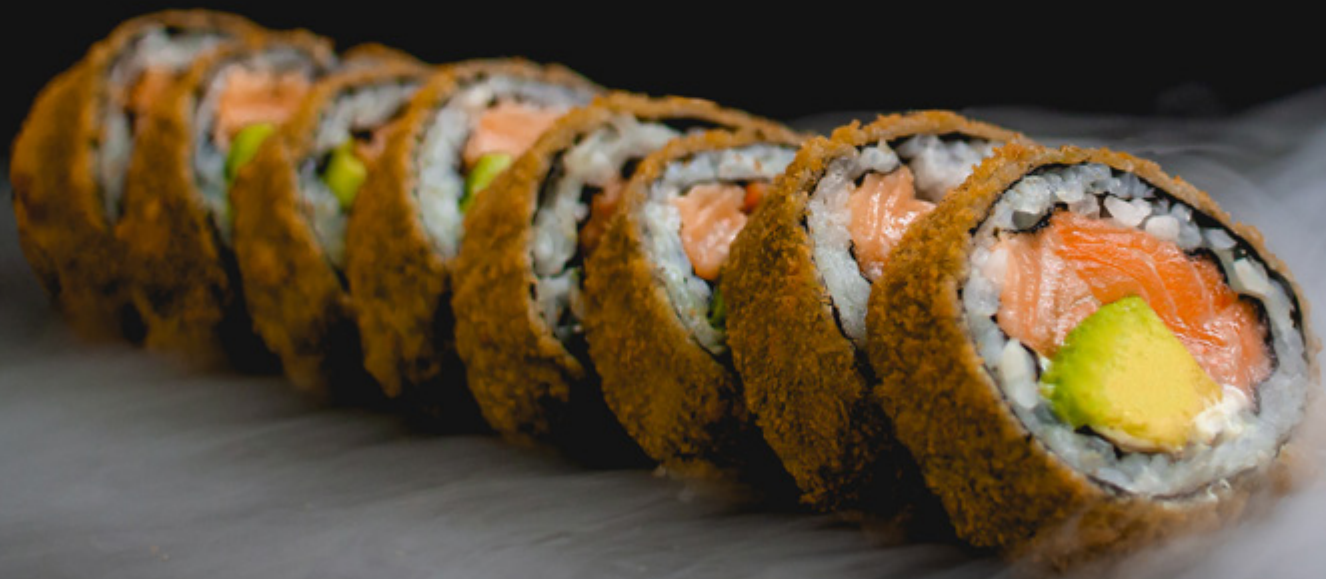
T37 - CRUNCHY SALMON