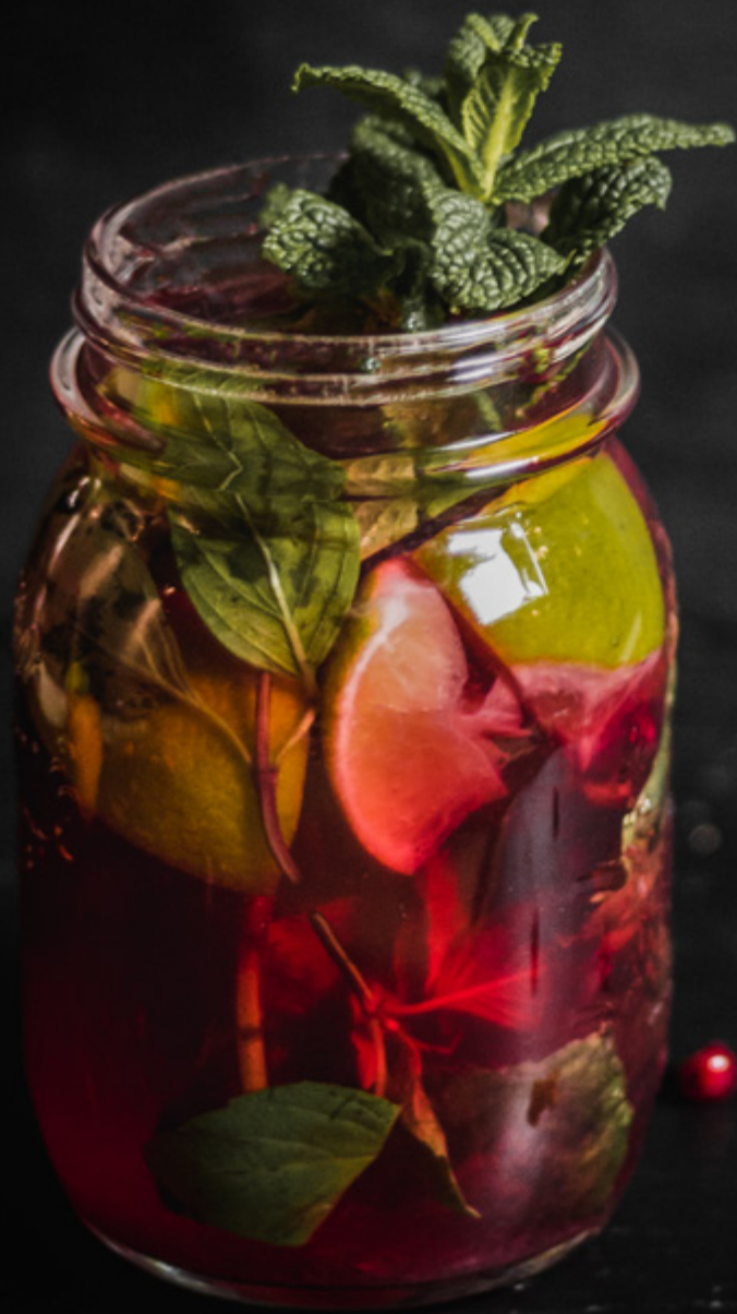
THAI BASIL LEMONADE